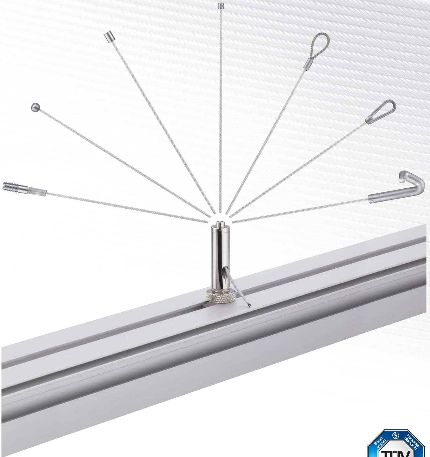
Abbildung zeigt SL000196